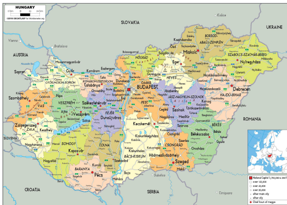
匈牙利行政地区图